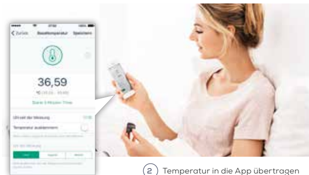
2 Temperatur in die App übertragen