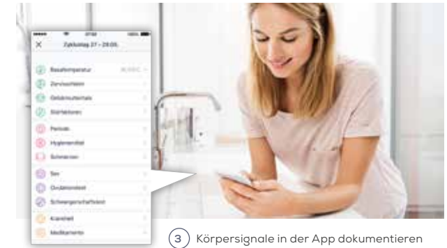
3 Körpersignale in der App dokumentieren