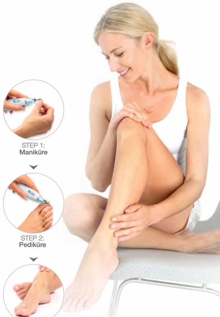
STEP 1: Maniküre

Gepflegte Hände sind die Visitenkarte Ihres ersten Eindrucks. Für schöne Hände und Füße bietet Beurer ein umfangreiches Maniküre- / Pediküre-Sortiment für Ihre professionelle Nagel- und Fußpflege zu Hause.