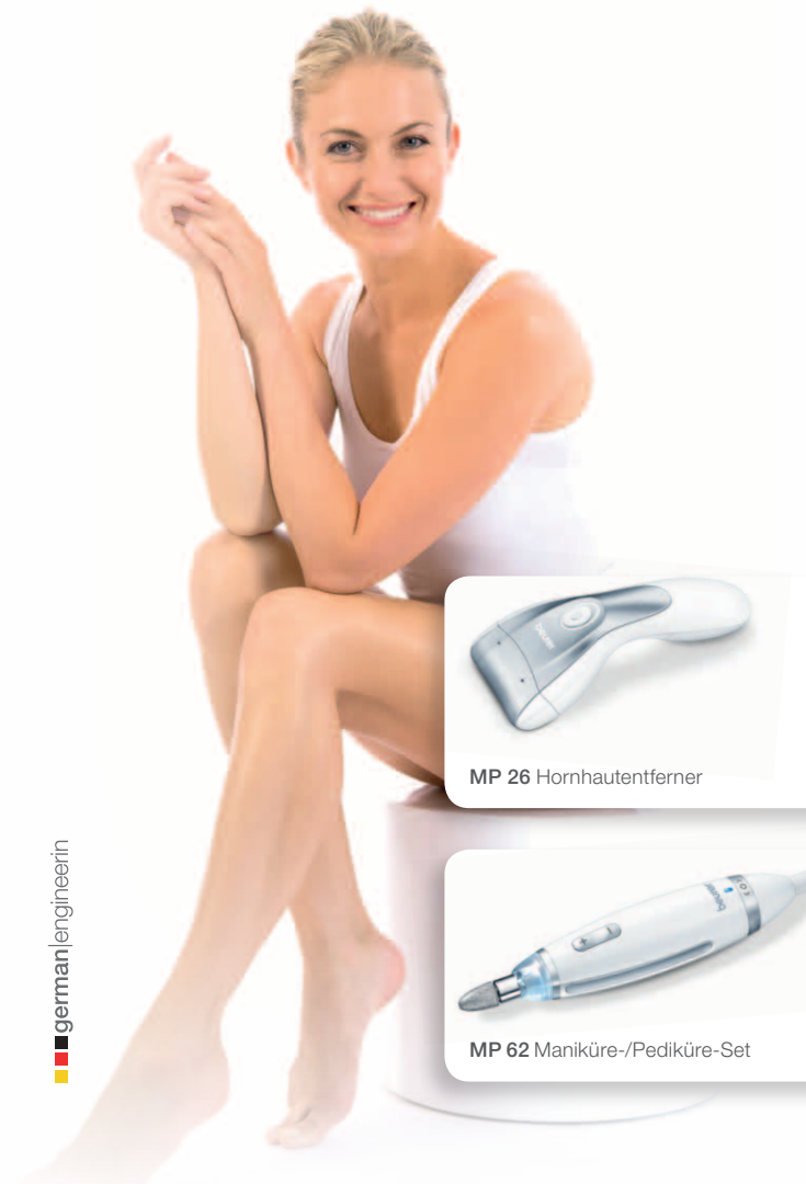
MP 26 Hornhautentferner