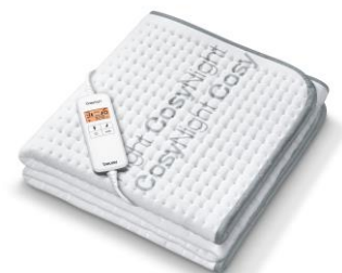
UB 190 CosyNight