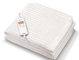
UB 200 CosyNight