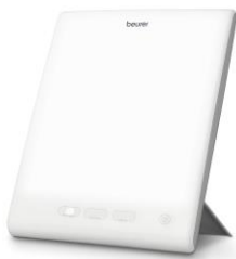
Therapy Modus 6.500 Kelvin Für mehr Energie

Voraussichtlich im März 2020 bringt der Ulmer Gesundheitsspezialist ein weiteres Gerät auf den Markt. Die Tageslichtlampe TL 45 Perfect Day ist das ideale Lichtsystem für einen energiereichen Tag. Das Produkt verfügt über eine Lichtstärke von 10.000 Lux (Abstand 20 cm) und drei Farbtemperaturen. Es unterstützt verschiedene Leistungs- und Ruhephasen mithilfe der Modi Therapy, Active und Relax.