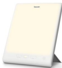
Active Modus 5.000 Kelvin Für Konzentration