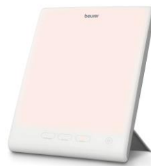
Relax Modus 3.000 Kelvin Für Entspannung

Die TL 45 simuliert auf diese Weise den natürlichen Lauf der Sonne und sorgt für einen geregelten Tages-Nacht-Rhythmus. So kann das Produkt durch die Lichttherapie einen frischen Start in den Morgen, konzentriertes Arbeiten am Tag oder einen entspannten Ausklang am Abend fördern. Die Touch Bedienung und die energiesparende LED-Technologie machen die Anwendung besonders nutzerfreundlich und die Tageslichtlampe zum optimalen Begleiter zu Hause oder im Büro.